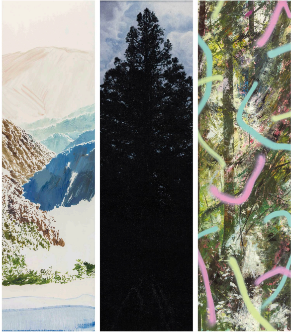
Chih-Hung KUO 郭志宏